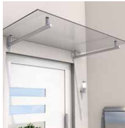
Festes Dach als Regenschutz: Die Kombination aus Echtglas und Edelstahl stellt eine hochwertige Lösung dar.