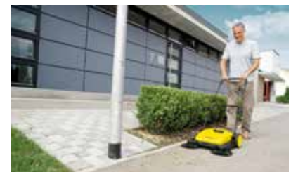
Mit einer modernen Handkehrmaschine wird die wöchentliche Kehrwoche zum Kinderspiel.

Um ein optimales Reinigungsergebnis mit der Kehrmaschine zu erzielen, gilt es die richtige Auswahl zu treffen. „Verbraucher sollten auf eine entsprechende Verarbeitungsqualität und einen hohen Handhabungskomfort achten“, empfiehlt Experte Ralf Rapp von Kärcher. Auch auf die Arbeitsbreite, die Größe des Auffangbehälters sowie die Lagermöglichkei-