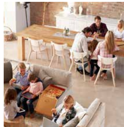
Zuhause wohlfühlen: Komfortables Heizen und Kühlen trägt stark dazu bei.

Falls Baumteile auf ein Auto fallen oder ein Baum auf das Nachbargrundstück stürzt, können Ersatzansprüche des Geschädigten einen mehrstelligen Betrag erreichen. Deshalb ist eine Privat- oder Haus- und Grundbesitzer-Haftpflichtversicherung ratsam. „Diese wehrt im Übrigen auch unberechtigte Ansprüche ab, wenn den Eigentümer keine Schadenersatzpflicht trifft“, ergänzt Manekeller. Schäden am eigenen Hab und Gut, die durch einen sturmbedingt umgestürzten Baum entstehen, sind ein Fall für die Hausrat- oder Wohngebäudeversicherung. Auch diese ist nicht nur für Eigentümer von Bäumen empfehlenswert. Sobald Windstärke 8 erreicht ist, handelt es sich im Sinne der Versicherungsbedingungen um einen Sturm. Für Hochwasserschäden durch über die Ufer tretende Flüsse oder beispielsweise durch einen Rückstau aus der überforderten Kanalisation nach einem Starkregen kommt wiederum die Elementarschadenversicherung auf. Diese kann in der Regel in die Gebäudeversicherung eingeschlossen werden.