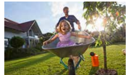
Der künftigen Generationen eine intakte Umwelt hinterlassen.

Wer ökologisch heizen will, muss sich erst einmal informieren. Schlüssige Antworten liefert beispielsweise der Flüssiggasversorger Primagas: Sie bringen nach eigenen Angaben als erster deutscher Anbieter biogenes Flüssiggas (BioLPG) auf den Markt. Der neue Energieträger, der netzunabhängig zur Verfügung steht, wird aus organischen Rest- und Abfallstoffen sowie nachwachsenden Rohstoffen gewonnen. „Mit BioLPG können wir die CO2-Emissionen von Flüssiggasheizungen von heute auf morgen deutlich reduzieren“, sagt Primagas-Geschäftsführer Jobst-Dietrich Diercks. Auf diese Weise bietet man den Kunden die Möglichkeit, die Wärmewende aktiv mitzugestalten. Infos: www.bioplg.de rgz