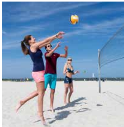
Bei Volleyballturnieren am Strand kann man sich so richtig austoben.

Denn die Nachfrage nach allergikerfreundlichen und hygienischen Böden in Naturqualität wächst unaufhörlich. Die Bodenbeläge wirken nicht nur besonders edel, dank ihrer speziellen Eigenschaften dämpfen die Böden