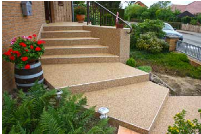
Langlebig und attraktiv zugleich: Natursteinteppeiche aus Quarzkies oder Marmorgranulat bieten dem Handwerksprofi vielfältige Gestaltungsmöglichkeiten.

handelt es sich um sogenannte Natursteinteppeiche, für die hochwertiger Quarzkies oder feines Marmorgranulat in einem Spezialharz gebunden wird. Das Material wird als geschlossene Fläche ohne Fugen innen wie außen aufgetragen. Es ist besonders langlebig, natürlich und damit auch für Allergiker gut geeignet. Bodengestalter, Fliesenleger oder auch Malerbetriebe, die ein zusätzliches Betätigungsfeld suchen, können sich entsprechend qualifizieren und das Naturmaterial dann sowohl Privats als auch Gewerbekunden anbieten. Die Startkosten liegen im niedrigen vierstelligen Bereich, die Erfolgsaussichten sind sehr gut.