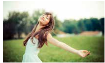
Zuviel Sonne sollte man vermeiden, sonst droht ein Sonnenbrand.

Sieben von zehn Deutschen zwischen 18 und 29 Jahren haben mindestens einen Sonnenbrand pro Jahr, das ergab eine Forsa-Umfrage. Besonders groß ist die Gefahr in den Bergen oder bei hoher Reflektion, zum Beispiel am Strand. Neben Sonnencreme mit hohem Lichtschutzfaktor schützt die richtige Kleidung die Haut: Je enger die Fäden und je kräftiger die Farben, desto weniger UV-Licht durchdringt sie. Hat man sich trotz aller Vorsicht einen Sonnenbrand zugezogen, kann beispielsweise Combudoron von Weleda Linderung verschaffen. Das fettfreie Gel mit Auszügen aus Arnika und der Kleinen Brennnessel kann kühlend, schmerz- und juckreizlindernd wirken. Infos: www.weleda.de rgz