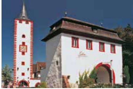
Die Renovierung vor etwa 25 Jahren gab dem „Katzenturm“ die Farbfassung zurück, mit der er im 16. Jahrhundert bemalt worden war.